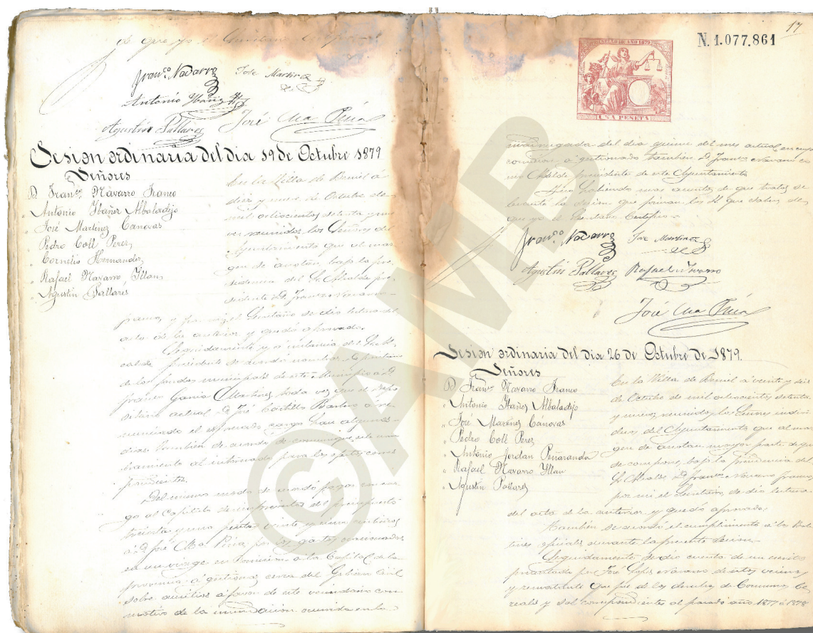
Acta de pleno de la sesión ordinaria del 19 de octubre de 1879.

Durante siglos la cuenca del Segura ha vivido bajo la amenaza de crecidas del río e inundaciones, la primera riada de la que se tiene constancia documental fue en 1143, la denominada riada de Santa Lucía, pero la riada más famosa de la Región tuvo lugar en la madrugada del 15 de octubre de 1879, la Riada de Santa Teresa , la más catastrófica acaecida en toda la Historia de nuestra Región, a través de los documentos y las crónicas que se escribieron en la época, conocemos que se llevó la vida de más de mil personas, ya que el río Guadalentín, al unirse con el Segura, también en crecida, ocasionó la inundación de toda la Vega Baja hasta el mar, llegando con un enorme caudal hasta la ciudad de Murcia y su huerta.