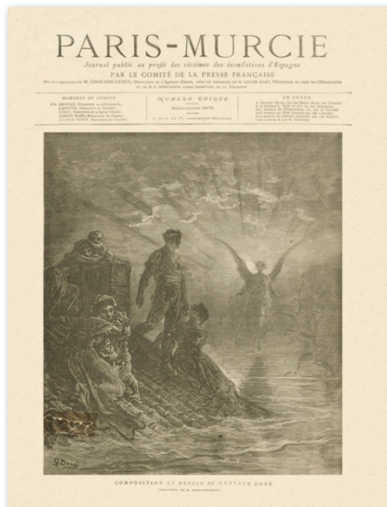
Ejemplar de Paris-Murcia, publicado el 14 de diciembre de 1879, con tirada de 300.000 ejemplares, al precio de un franco.

En el Archivo Municipal, existe documentación sobre las diferentes inundaciones que este municipio ha sufrido y que estos días, los diferentes medios de comunicación nos han hecho recordar, tras esta última catástrofe. Este mes queremos dar a conocer, la referencia más antigua que nos consta de las inundaciones, concretamente de esa gran riada, en las actas de pleno más antiguas que se conservan del Ayuntamiento, en la sesión ordinaria del 19 de octubre de 1879, se da testimonio de incluir en los gastos imprevistos, el viaje en Comisión al Gobierno Civil de Murcia, para la gestión de los auxilios a este vecindario, con motivo de la riada de Santa Teresa. El documento que mostramos, da testimonio de la vulnerabilidad que sigue teniendo Beniel, por su situación al encontrarse en el eje del río, con sus ramblas y afluentes ante el riesgo de inundación, recordando que han pasado muchos años desde la última vez, en el que el agua, devastó un pueblo de manera cruel.