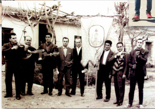
Imágenes de las diferentes agrupaciones a lo largo de su historia.

Esta forma de arte ha llegado a nuestros días, gracias a estas agrupaciones musicales y su labor de potenciar una parte de nuestro folclore más tradicional, que al igual que ellos aprendieron de sus padres, permiten que las nuevas generaciones lo conozcan, se involucren y no desaparezcan. Durante las fechas navideñas han sabido impregnar ese sentimiento a través de la interpretación de la música, con sus Aguilandos y Villancicos. Una dedicación especial de todos y cada uno de los miembros que han pasado por ellas a lo largo de su historia, que nos permite al escuchar estas melodías, volver a un tiempo pasado y nos evoca a no olvidar los sonidos tradicionales de la Navidad.