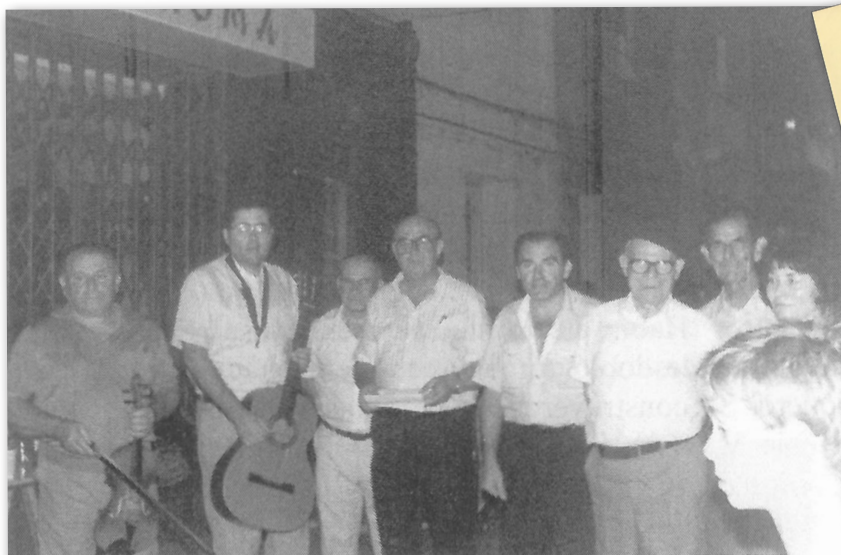
Primeras interpretaciones del Canto a Beniel, con sus autores.

Imagen de la publicación de Govert Westerveld. 2011.