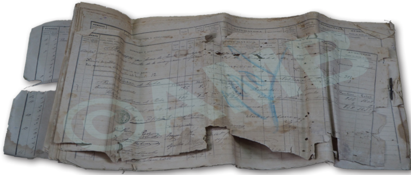
Censo de Población. 1900